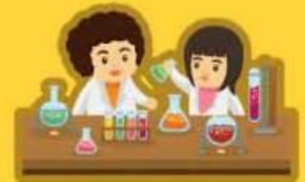
ผู้ที่ทำงานในห้องแล็บ ที่มีเชื้อพิษสุนัขบ้า