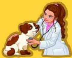
สัตวแพทย์ ผู้ช่วยในคลินิกสัตวแพทย์