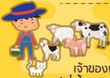
เจ้าของฟาร์ม ผู้ที่เลี้ยงสัตว์ขาย